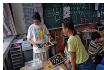
最後は先生も一緒に遊んじゃおう