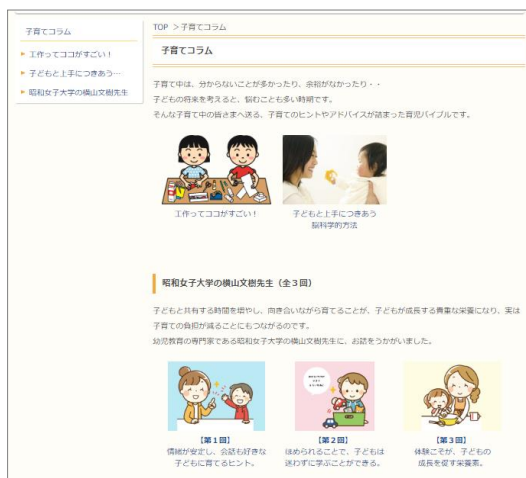
新設した「子育てコラム」