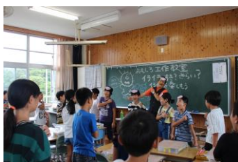
工作の前に、頭と体をほぐします！