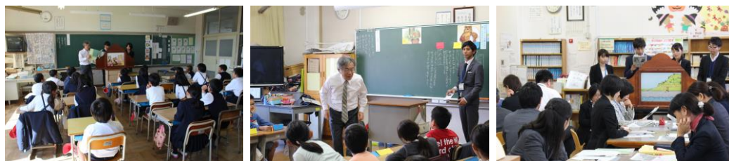
大型紙芝居で上演