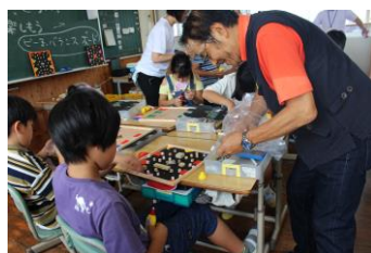
“ちゃんしの”が少しだけお手伝い