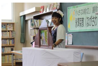
プロの声優さんが目の前で！