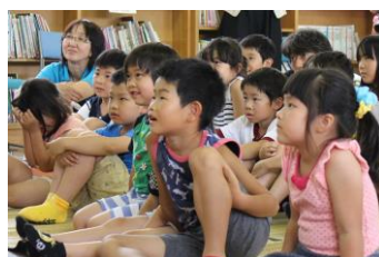
食い入るように見つめる子どもたち