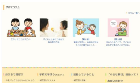
“てらこあん” トップページで紹介