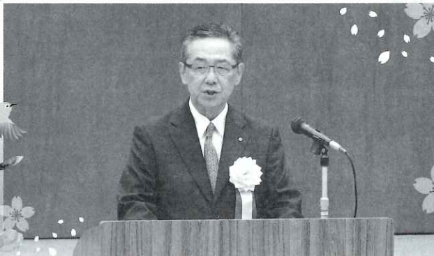
あいさつする綾田代表